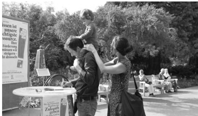
Unterschriften sammeln im Botanischen Garten

Heute und morgen lädt die MIN-Fakultät unter dem Motto Ideenwelt & Sofaworkshop alle – Bürger, Studierende, Schüler und Lehrende – zur öffentlichen Diskussion